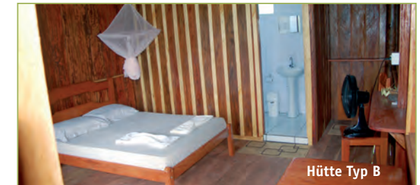
Hütte Typ B

Luxus wird man am Juma Lake Inn vergeblich suchen, aber auch nicht vermissen: Hier lernen Sie das authentische und unverfälschte Leben der Caboclos kennen . Genießen Sie die herzliche Gastfreundschaft und lassen Sie sich vom großen Engagement und von den Kenntnissen der Guides beeindrucken.